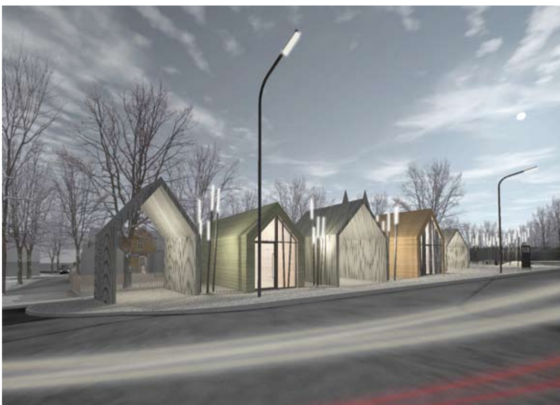
Būsimų kioskų eilė šalia Gegužės gatvės.