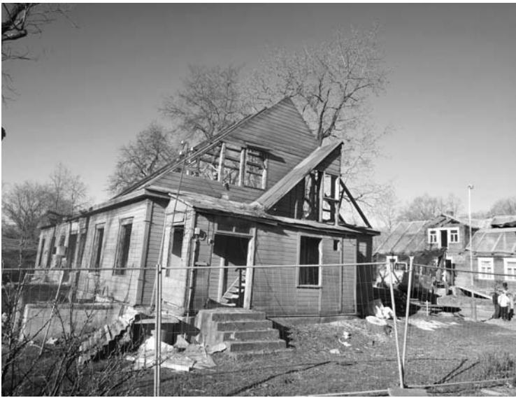
Karvelių namas (pirmajame plane) dabar jau visiškai išardytas. Jis turi būti atstatytas lygiai toks, kaip buvo.