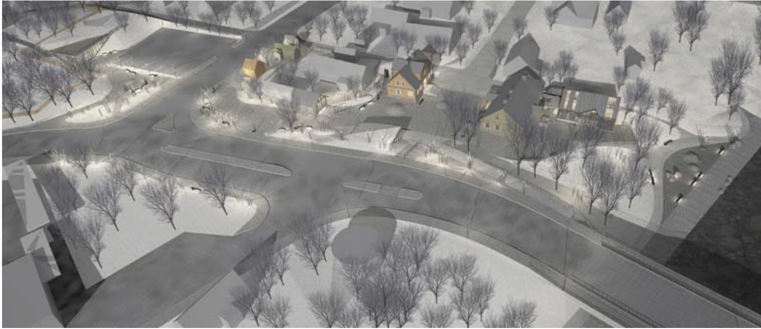
Bendra Tilto gatvės projekto vizualizacija.

Projektas turi būti baigtas 2021 metų birželio 18 dieną. Jį atlikus visas nedidelis Anykščių kvartalas iš esmės pakeis ankstesnį vaizdą.